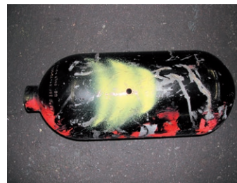
Sachgemässe Anlieferung Flüssiggas-Tank/Gasflasche: Beispiel demontierter Gasflasche mit Lochung