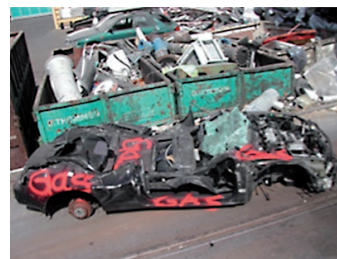
Sachgemässe Anlieferung Fahrzeug: LPG-Fahrzeug mit Kennzeichnung «Gas»